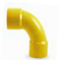
ข้อโค้ง 90H บาน2ร้อยสาย (ช่วงสั้น) SHORT BEND 90 H ES 2 TOT