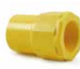
ข้อต่อเข้ากล่องร้อยสาย สีเหลือง CONNECTOR - TOT