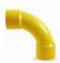
ข้อโค้ง 90H บาน2ร้อยสาย BEND 90 H ES 2 TOT