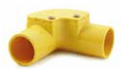
ข้ออ 90° ฝาเปิดร้อยสาย สีเหลือง INSPECTION ELBOW 90°-TOT